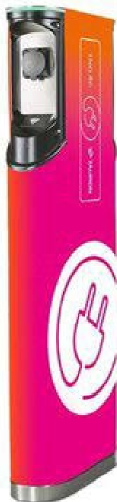
Rys.1 Przykładowa stacja ładowania o mocy 22 kW ładowania ING – Tauron Polska Energia S.A. [media.tauron.pl]

Okolice budynków użyteczności publicznej. Teatry, kina, baseny – to przykłady miejsc, dla których z dużym prawdopodobieństwem można określić godzinę zakończenia wykonywanej aktywności. Kierowca pozostawi pojazd do ładowania na zaplanowany, określony czas. Podobne lokalizacje, dla których przynajmniej w pewnym zakresie można regulować czas trwania aktywności, to cmentarze, banki, urzędy, salony fryzjerskie, centra miast itp. Office parki. Pomimo, że lokalizacja przeznaczona jest przede wszystkim dla pracowników i gości firm, punkt ładowania może być udostępniany publicznie wtedy, kiedy nie jest użytkowany, lub w określonych przedziałach czasowych w ciągu doby.